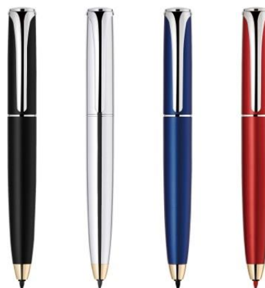
『フィラーレ ディレクション』高級サインペン 2021年11月発売