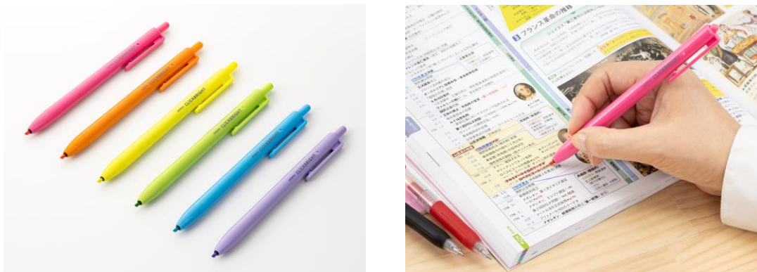
▲『クリックブライツ』 価格：¥132 (税抜価格¥120) ノック式蛍光ペン 水性染料 インク色：全6色 (写真左から) ピンク、オレンジ、黄、緑、ライトブルー、紫

ゼブラ株式会社(本社：東京都新宿区／代表取締役社長：石川 太郎)は、従来の半分の線幅で細かい文字まで目立たせることができるペン先「ハーフラインチップ」を搭載したノック式蛍光ペン『クリックブライツ』を、2023年11月20日(月)より、全国文具取扱店にて発売します。