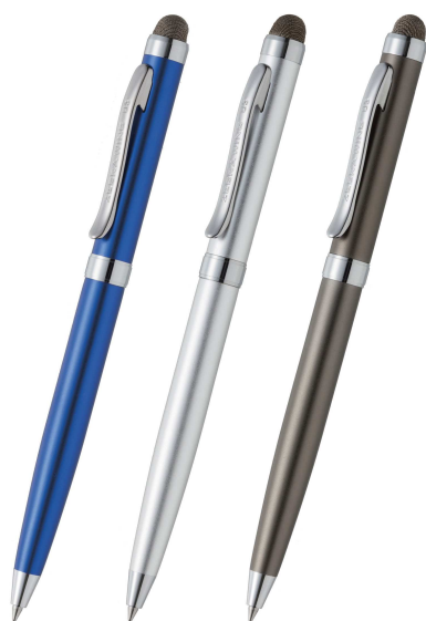
『スタイラスU3』 油性ボールペン付きタッチペン 2012年発売 オープンプライス 想定価格 2,000円+税

ゼブラの筆記具へのこだわりと高い品質で作られたシリーズです。使いやすさと安心感、コストパフォーマンスの高さで売り上げを伸ばしています。ボールペンは全て4C芯を採用のため、中芯交換の際にゼブラの豊富なラインナップから選べます。(油性インク・ジェルインク・ゼブラ独自のエマルジョンインク)