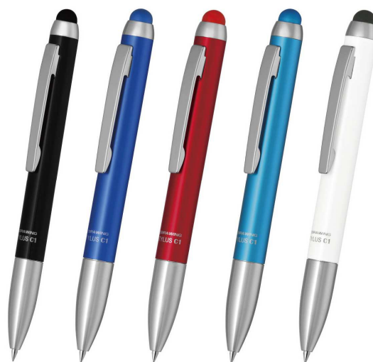
『スタイラス C1』 油性ボールペン付きタッチペン 2014年発売 価格: 380円+税