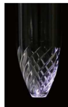
光の屈折効果を生み出す溝形状