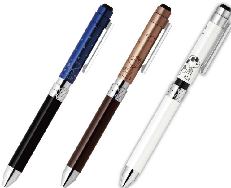
軸色: スヌーピー ネイビー 軸色: フライング・エース ブロンズ 軸色: ジョークール ホワイト

『シャープ X スヌーピーコレクション』 価格 ¥6,000+税(リフィル別売 ¥80~+税)