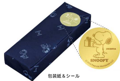
包装紙 & シール