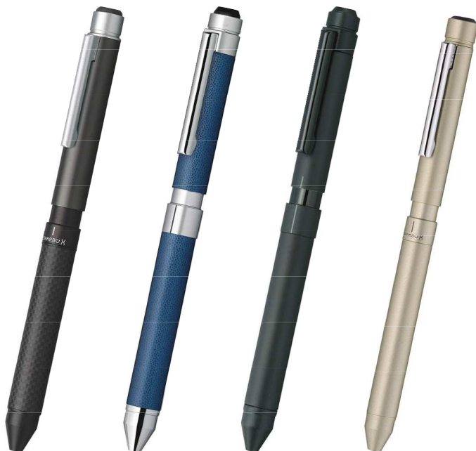
シャープ X CB8 シャープ X CL5 シャープ X ST3 シャープ X LT3