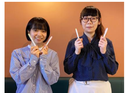
△マイルドライナー開発チーム

「自分のノートが可愛くなると、よし！がんばろう！と気合いが入ると思っています。今回の色も文字にアンダーラインを引くのはもちろん、思わずさらにイラストも描きたくなるようなイメージが膨らむ色味にこだわりました。いつもの使い方にプラスして、例えば、文字の周りにフレームを描いてみたり、楽しんでもらえたらと思います。」