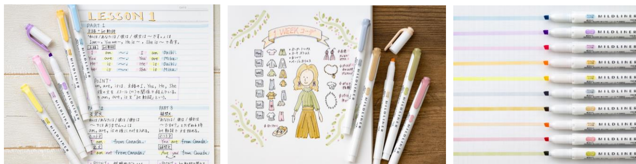
△勉強ノートにおすすめのやさしさマイルド色