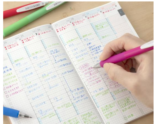
△小さいマス目にもくっきりカラフルに書ける

『サラサナノ』価格：¥220（税抜価格¥200）ジェルボールペン 水性顔料インク・耐水性 ボール径：0.3 mm 全32色 替芯：JF-0.3 芯（黒、青、赤、ブルーブラックのみ） インク色名は2枚目に記載