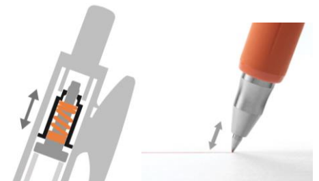
△うるふわクッション（イメージ図） スプリングにより中芯を動かし筆記時のガリガリ感を吸収する。

3. デザインでは、ジェルインクのみずみずしさをクリップやノックの透明部分で表現しました。また、金属製の先端部分は、書いているところが見えやすいような形状にし、ほどよい低重心を実現しています。