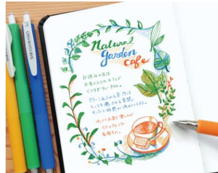
△手帳をキレイに仕上げたい時に

仕事する場所が多様化したことで小さな手帳が好まれていることや、手帳に細かく書き込んでキレイに仕上げたものを SNS で紹介する人が増えていることなどから、極細タイプのボールペン人気が高まっています。「サラサナノ」は細かいところにもくっきりキレイに書いて、手帳をカラフルに彩ることができます。