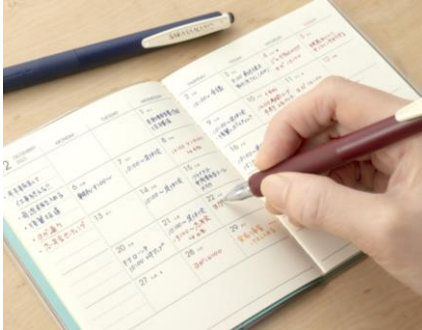
△小さな手帳に書き込みたい時に