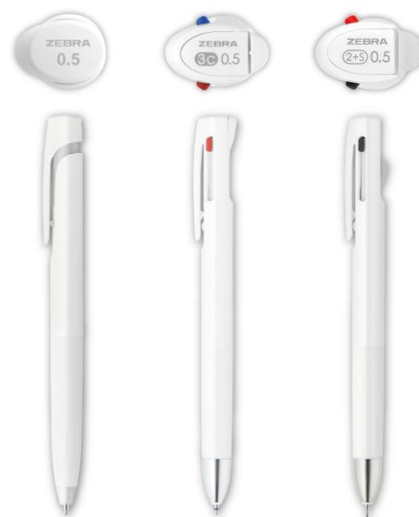
▲ブレン、ブレン 3C、ブレン 2+S