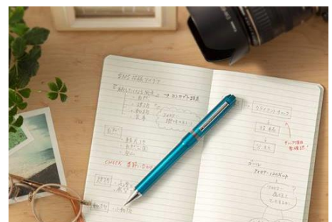
▲ 昭和から令和に受け継ぐシャーボ Nu