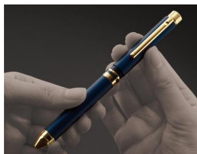
▲ フラッグシップモデルのシャーボX