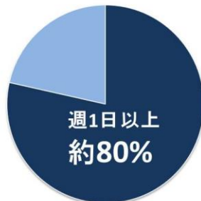
【多機能ペンのシャープペンの使用頻度】

(1,000円以上の多機能ペンシャープを週1日以上使用している社会人 n=400)