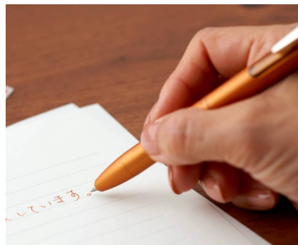
さりげない個性の演出を