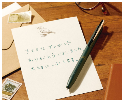
アナログならではのあたたかみ