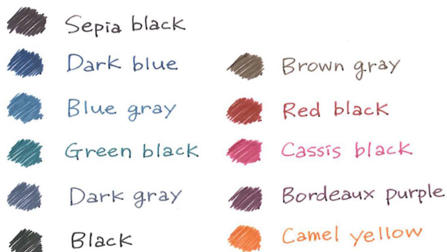
△サラサグランド ビンテージカラーインク 筆記線色見本

最近ではニュアンスカラー、くすみカラーと呼ばれる黒やグレーがかかった渋みのあるトーンがファッションでトレンドとして認知されています。落ち着いた色合いが特長のビンテージカラーを使って手帳や手紙を書くことで、おしゃれな雰囲気仕上がりになります。