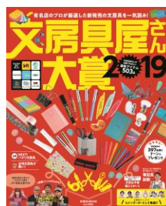
『文房具屋さん大賞』(扶桑社) 2019年2月発売

ここ1年に発売された文房具の中から、全国文具店に勤める文具のプロが優れた商品を選ぶ『文房具屋さん大賞』。2019年版ではボールペン部門で、『ブレン』が1位に輝きました。