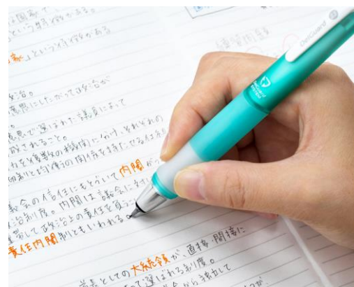
△長時間使用しても、指が痛くなりくいグリップ

『デルガード タイプ GR』価格：¥700+税（税込¥756） ■GR…グリップの意味 軸色：ブラック、ブルー、レッド、コーラルピンク、ミントグリーン、ホワイト