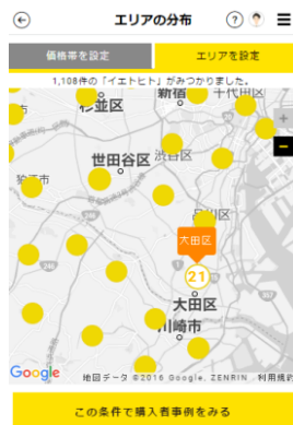
地図からエリアを絞り込んで 住宅購入者事例を検索