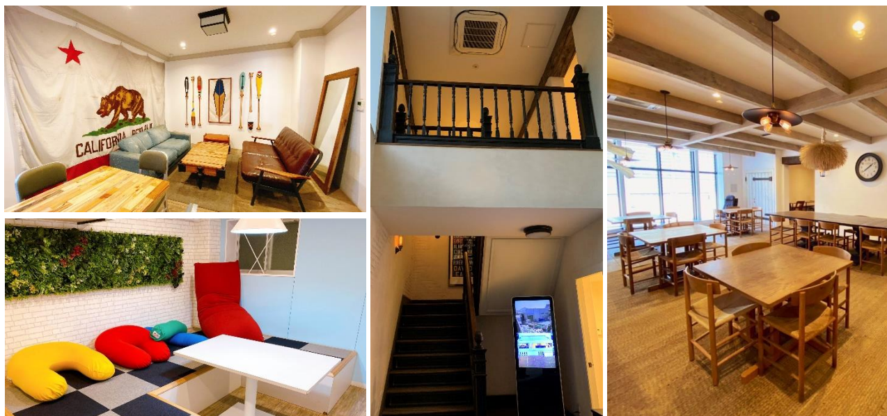
東京リサイクルセンター

●URL： https://www.youtube.com/watch?v=42uvOVxi_vM&feature=emb_title