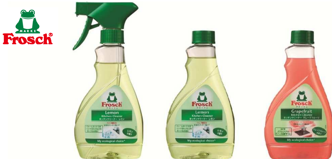
キッチンクリーナー レモン (本体) レモン (つけかえ用) グレープフルーツ (つけかえ用)

フロッシュブランドは、昨春の発売以来、使う人の好みやシーンに合わせ選べるよう、定期的に商品ラインアップの拡充をすすめ、順調に売り上げを拡大しています。今春、フロッシュブランド販売開始1周年を迎え、その記念として4月から積極的にプロモーションを行っていきます。また、今後も引き続き、製造元であるヴェルナー&メルツ社との共同開発や、旭化成グループ独自の技術開発を進めるとともに、キッチン衛生用品領域における各種製品を積極的に展開していきます。