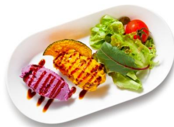
・ 紫芋とパンプキンのサラダ ¥429