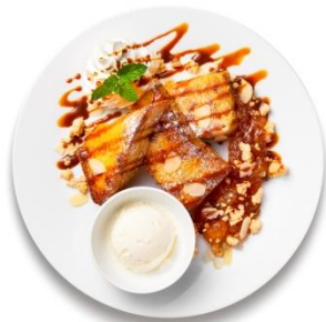
・ フレンチトーストアップルパイ風 ¥799