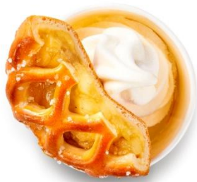
・ アップルパイサンデー ¥250