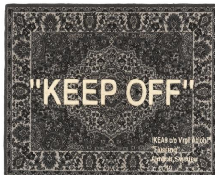
MARKERAD ラグ パイル短(Keep OFF) W133×H195cm IKEA FAMILY メンバー限定価格 ¥24,990 通常価格 ¥29,990