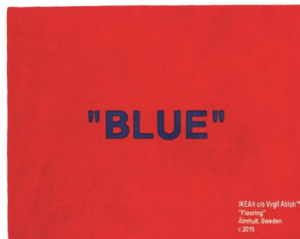
MARKERAD ラグ パイル短(Blue) W200×H250cm IKEA FAMILY メンバー限定価格 ¥39,990 通常価格 ¥49,990