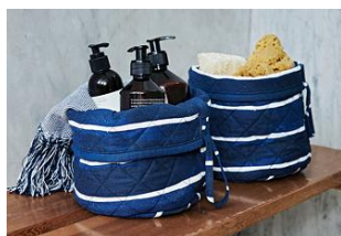
INNEHÅLLSRIK バスケット 18cm 手織り ブルー/ホワイト ¥999