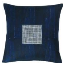
INNEHÅLLSRIK クッションカバー 50x50cm 手織り ブルー ¥1,499