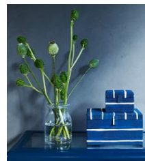
INNEHÅLLSRIK ふた付ボックス 手織り 青/白 小 ¥999 大 ¥1,499