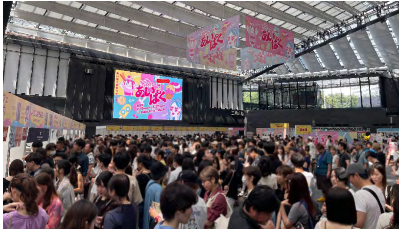
2024 年に新宿住友ビル三角広場で開催された「あいぱく® Premium TOKYO 2024」の様子

はもちろん、約 564 インチ (W12.5m×H7m) の 4K 大型ビジョンでの CM 放映、サンプリング実施、公式 HP バナー掲載、会場内看板パネルへのロゴ掲出など、多様な協賛プランをご用意。アイスクリーム業界に限らず、幅広い分野の企業様との連携を通じて、本イベントを新たな価値創造の場とし、参加者に一層の感動体験を提供したいと考えております。