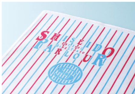
青と赤のストライプが印象的な資生堂パーラーオリジナル風呂敷。 サイズは約60×60cm、素材は綿100%でできています。