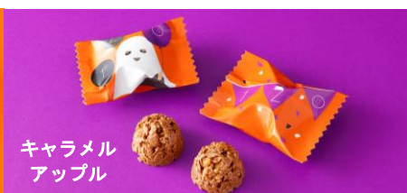
キャラメル アップル