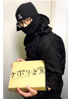
民泊施設配達時の忍者ユニフォーム