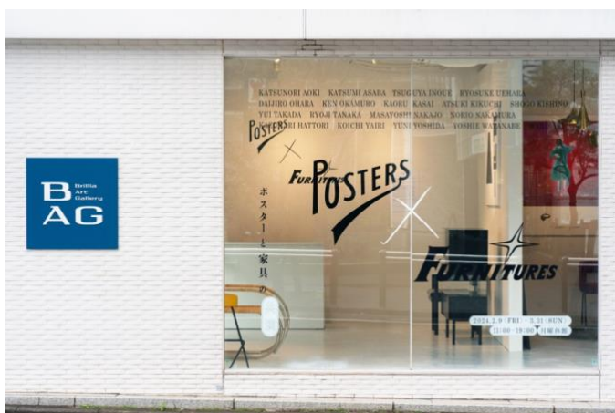
写真=『POSTERS × FURNITURES』で展示中の「ルーファス」によるキャンバス製ポスター