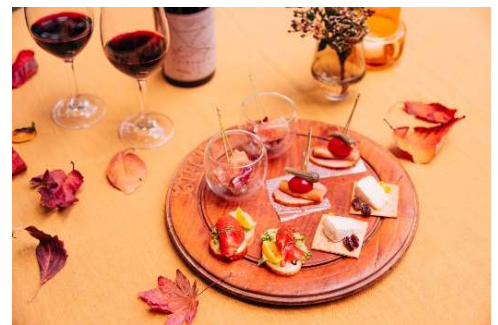
カナッペイメージ