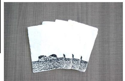
山路紙ポストカード イメージ