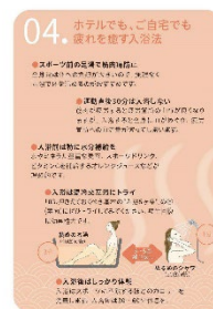
温泉指南書 イメージ