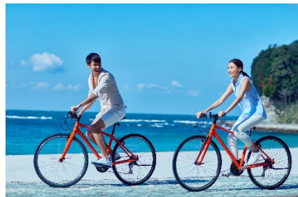
サイクリング イメージ