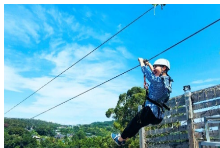
伊豆ぐらんぱる公園 イメージ