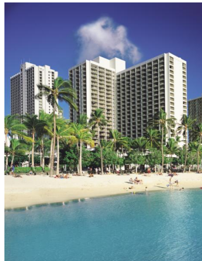
右) ハワイ ワイキキ・ビーチ・マリオット・リゾート&スパ