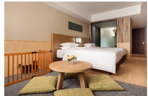
ドッグフレンドリールーム

※料金はご利用日、ご利用人数により異なります。詳しくはホテルまでお問い合わせください。