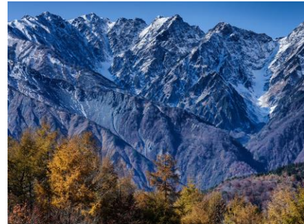
HAKUBA MOUNTAIN HARBOR から望む白馬三山

白馬岩岳山頂にある白馬三山を一望する山頂テラス「HAKUBA MOUNTAIN HARBOR」や、紅葉に染まる白馬岳が眼前に迫る「猿倉」、北アルプスの三段紅葉が見渡せる「鹿島槍スキー場」などを撮影しに巡ります。フォトセミナーでは画角や色彩の撮影技術をはじめとした補正加工技術を直接レクチャーしていただきます。