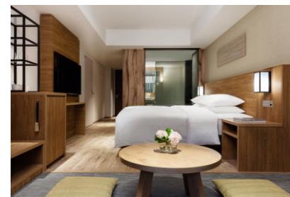
温泉付 プレミアールーム