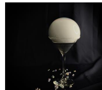
Hikoboshi Martini イメージ