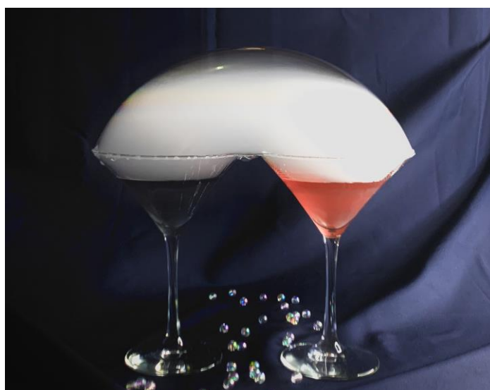
Milky Way Cocktail イメージ