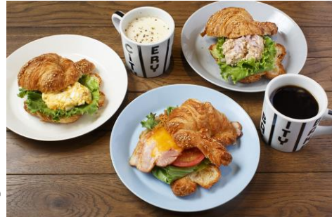
「THE CITY BAKERY」イメージ