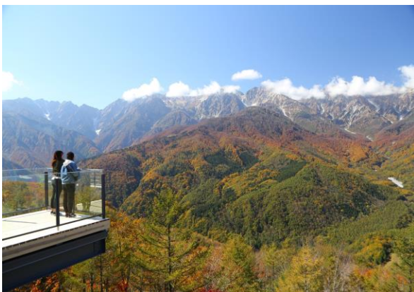
HAKUBA MOUNTAIN HARBOR イメージ