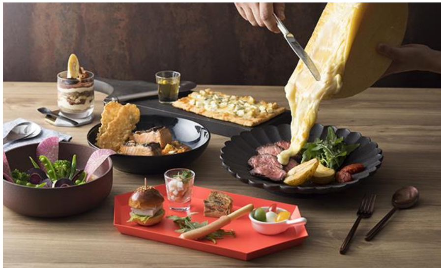
Winter Gathering ～ Cheese Mania ～イメージ