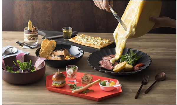
Winter Gathering ~ Cheese Mania ~イメージ

前菜からデザートまで様々な種類のチーズをふんだんに使った、コース仕立てのディナープランです。前菜には、濃厚な旨味のチェリーモッツァレラのカプレーゼ、クリームチーズとりんごのスライダーバーガーなど5種。冬の野菜芽キャベツやブロッコリーをとろとろのエメンタルチーズにディップしてお召し上がりいただくスナックや、カマンベールチーズやゴルゴンゾーラチーズなど4種のチーズのクワトロチーズピザなど、チーズづくしのメニューを揃えました。名前の通りチーズ好きにはたまらない、冬の楽しいお集まりにぴったりのプランです