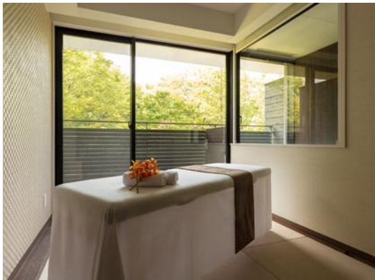
インルーム SPA イメージ