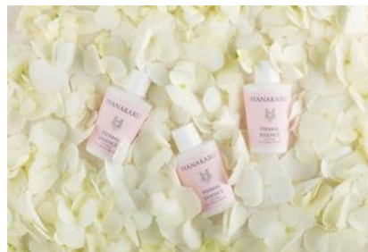
ミニチュアボトルイメージ