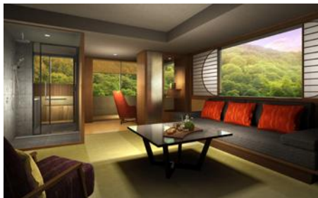
温泉露天風呂付スイートルームイメージ

翠嵐ラグジュアリーコレクションホテル京都では、2015年2月27日（金）の午前9時より、宿泊の予約受付を開始いたします。客室料金は定価*65,000円（モデレート約40㎡）から300,000円（スイートルーム約100㎡/テラス含む）まで、専用の温泉露天風呂や坪庭、日本庭園をお楽しみいただけるお部屋など全39室、多様な客室タイプを揃えています。客室タイプおよび料金の詳細は、近日中にホテルホームページで発表いたします。