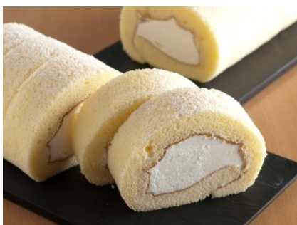
※塩と豆乳クリームの御殿山ロール