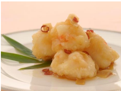
※海老の北京ソース