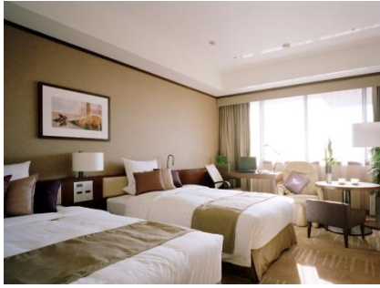
※スーパーリアデラックスツイン