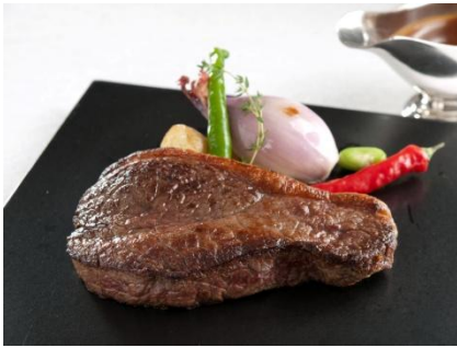
※ステーキディナー