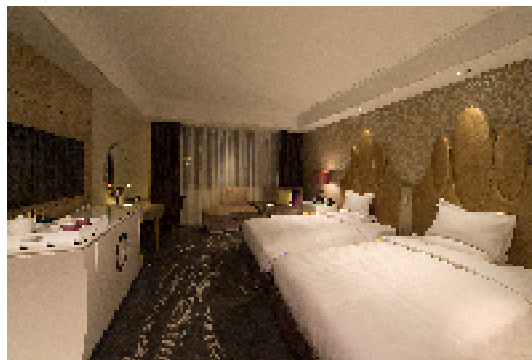
(画像資料：客室イメージ)