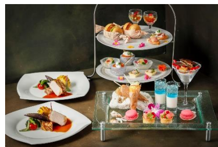
「Local Peach Night」イメージ