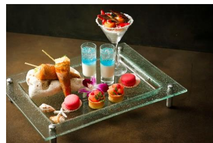
スイーツ イメージ