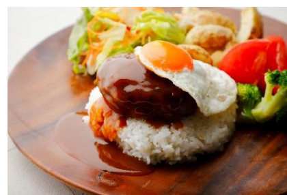
ロコモコプレート イメージ