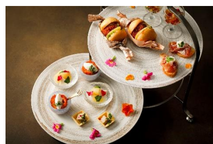
セイボリー イメージ