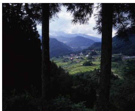
樹間の集落(小谷村)