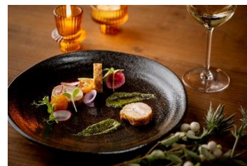
ディナーコース 前菜イメージ