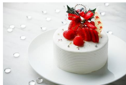
生クリームデコレーション イメージ

しっとりとした風味豊かなスポンジに、いちごと生クリームを重ね、糖度の高い滋賀県産ブランド苺「蜂蜜いちご」をトッピングしたケーキ。いちごそのものの甘みを引き立てる上品なクリームとともにお召し上がりください。