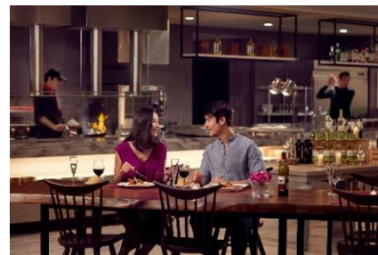
Grill & Dining G イメージ