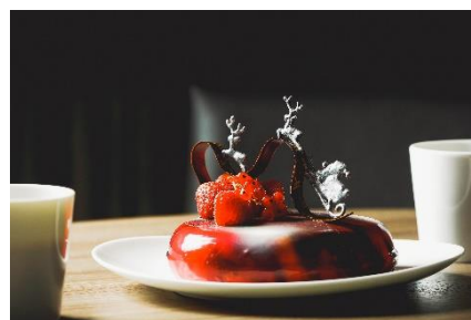
宿泊プラン限定クリスマスケーキ 「ノエルプラネット」イメージ