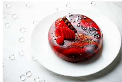
ノエルプラネット イメージ

プラネタリアムの星空の世界を描いたチョコレートに包まれたケーキ。色鮮やかなチョコレートの中は、アーモンドのスポンジをベースに和紅茶のクリームとアドベリーのジャムをムースで重ねました。甘酸っぱいムースとチョコレートのハーモニーに、ほんのり香る紅茶をお楽しみいただく、大人の味わいのケーキです。