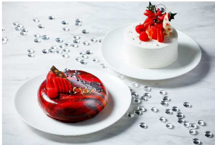
左：ノエルプラネット、右：生クリームデコレーション イメージ

ケーキご予約期間：2022年10月20日(木)～12月24日(土) 宿泊プラン販売期間：2022年12月1日(木)～12月25日(土)