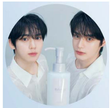
※1 うるおいを表現したビフェスタのアイコンマーク