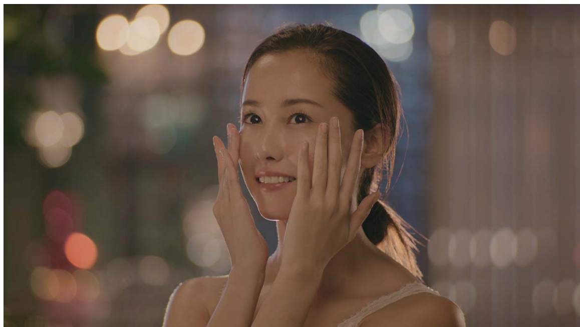
TV-CM『ワン ツー スリーピング編』

◆バリアリペア ブランドサイト https://www.barrier-repair.jp/