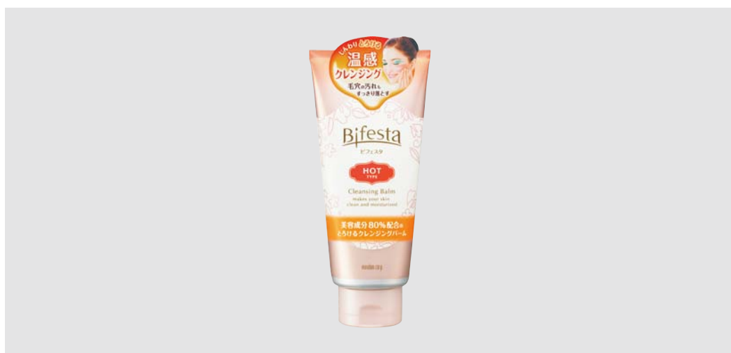
ビフェスタ クレンジングバーム ホットタイプ