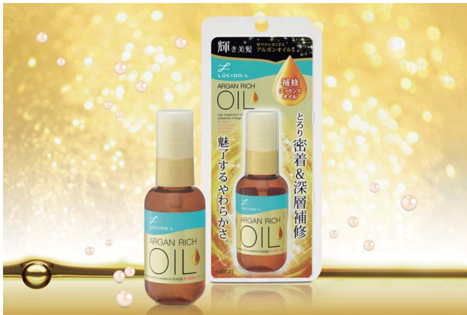
ルシードエル オイルトリートメント #EXヘアオイル エッセンスチャージ 58ml ¥1,200(税抜)

マンドム(本社:大阪市 社長執行役員:西村元延)は、「ルシードエル オイルトリートメントシリーズ」から、ダメージをしっかりと補修し、芯からやわらかな髪に仕上げる新機能補修オイル「ルシードエル オイルトリートメント #EXヘアオイル エッセンスチャージ」を、2016年8月29日(月)より新発売します。