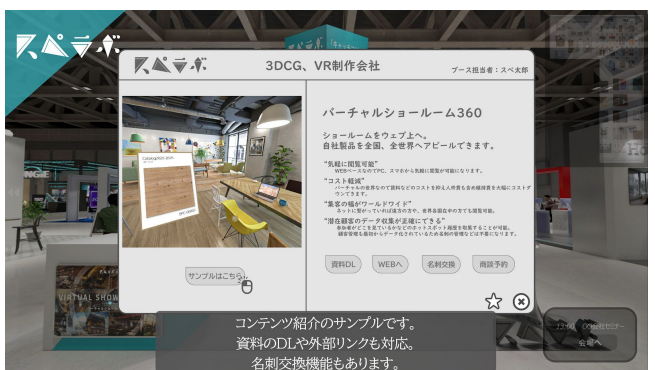
ブース内コンテンツ