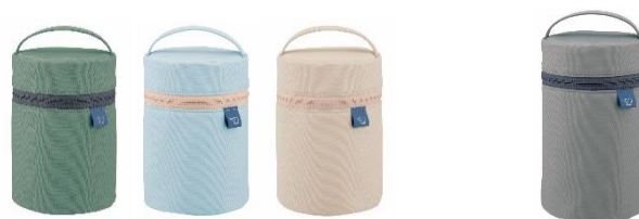
左より マットグリーン (-GM) アイスグレー (-HL) ベージュ (-CM)