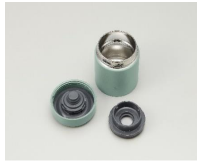
2022年新製品 SW-KA 型