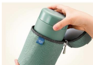
写真は SW-PB01 マットグリーン (-GM)