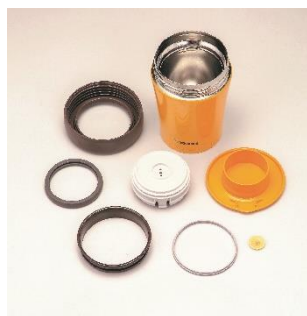
2021年当社従来品 SW-GD 型

“せん”と”パッキン”がひとつになった「シームレスせん」を搭載したことで、分解点数が多かった従来品と比較して、洗うのは本体を入れてたったの3点です。