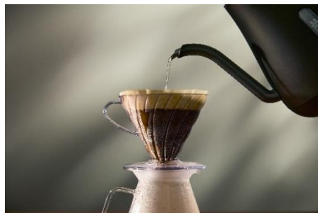
ドリッパーに干渉しにくいノズル形状