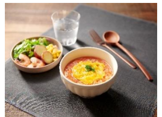
チーズオムライス風がゆ