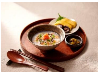
鮭と明太子のおかゆ

療養食としてのイメージが強いおかゆですが、昨今、健康志向が高い方中心に人気が高まっています。そこで、健康ニーズに応えるため、普段から食べていただきやすい「粒立ちがゆ」メニューを通常の「おかゆ」メニューに加え、搭載します。さらっとしてお米の粒感を楽しめる、おいしく健康的なメニューとして提案します。