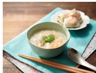
ベトナム風海鮮がゆ