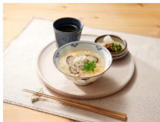
きのこことじゃこの卵がゆ