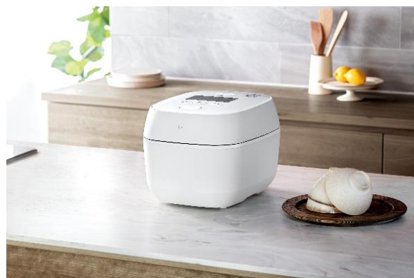
圧力IH炊飯ジャー「炎舞炊き」(NW-FC型)