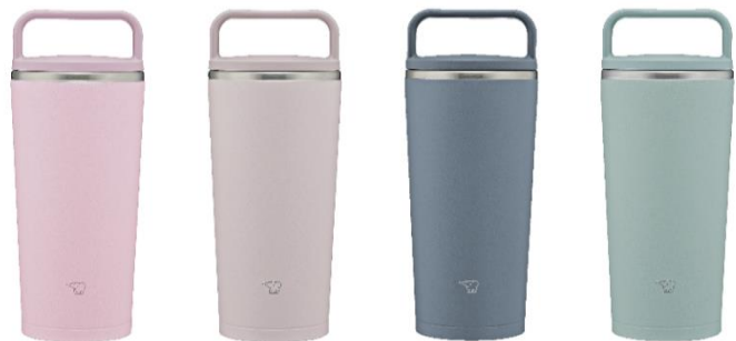
ステンレス キャリータンブラー 写真はSX-JS30