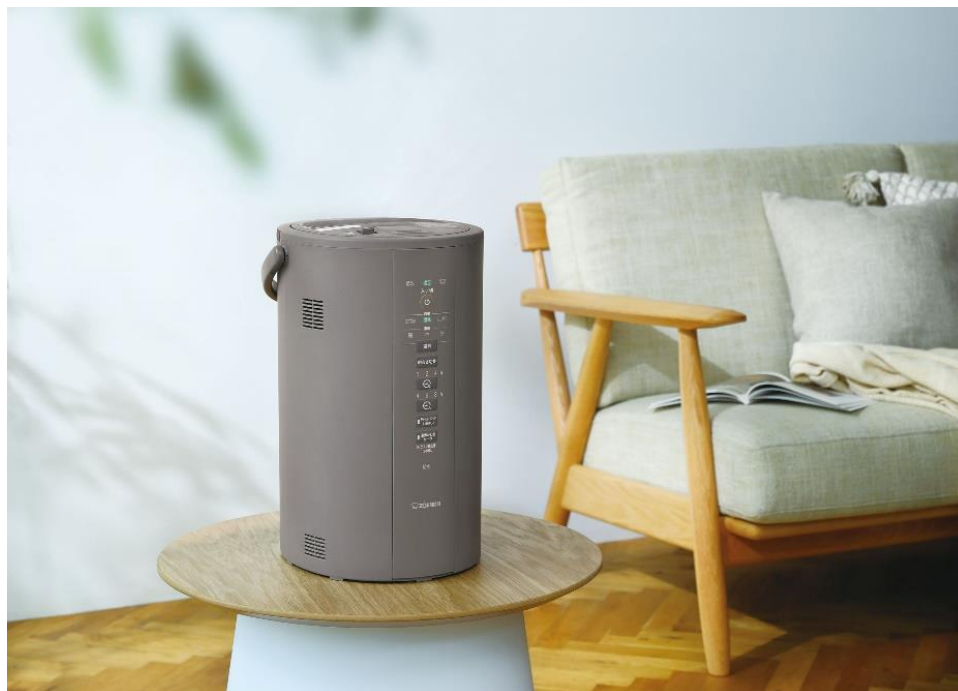
スチーム式加湿器(EE-DD35/50)

適用床面積: 木造和室~8畳(13m 2 )/プレハブ洋室~13畳(22m 2 ) 加湿能力: 480mL/h