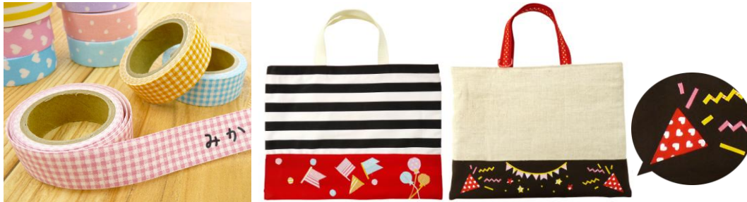
・くるりんネームテープ 1本入/全14種類/価格 各380円(税込 各411円)

今年のクラフトグループ店舗の入園・入学向け商品は「家族で入園・入学準備を楽しもう」をテーマに、楽しく手作りできるアイテムを数多く取り揃えています。アイロンで貼ることができる「くるりんネームテープ」なら、マスキングテープの要領で縫う手間もなく、入園入学グッズをオシャレにアレンジすることが出来るのでパパや男のお子様でも一緒に楽しむことができます。その他、お好みで塗り絵を楽しむことが出来る生地や布専用の絵の具やクレヨンなど、オリジナリティ溢れる通園通学グッズにアレンジができるアイテムでお子様の新しい門出に向けて、準備からご家族で楽しんでみてはいかがでしょうか。